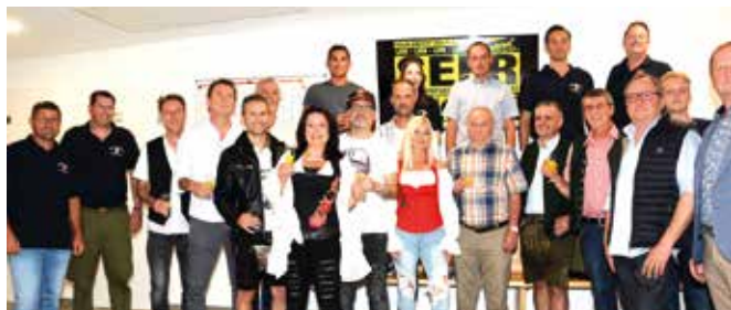
„Meet-Greet“ vor Beginn mit den Seern und den Sponsoren.