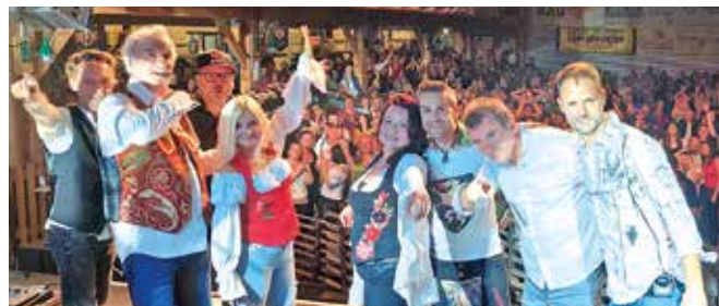
Die Seer begeisterten ihre vielen Fans in der Kulmblickhalle.