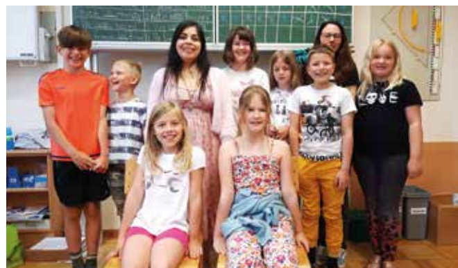
Großen Spaß bereitet den Kindern der Englisch-Unterricht.