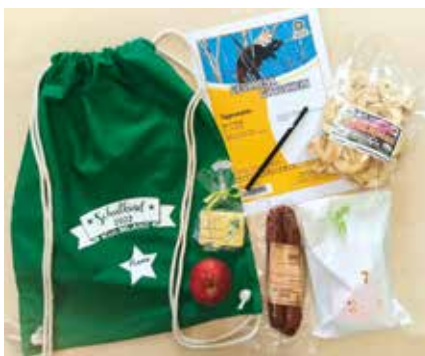
Ein Sackerl aus Bio-Baumwolle mit tollen und leckeren regionalen Inhalten.