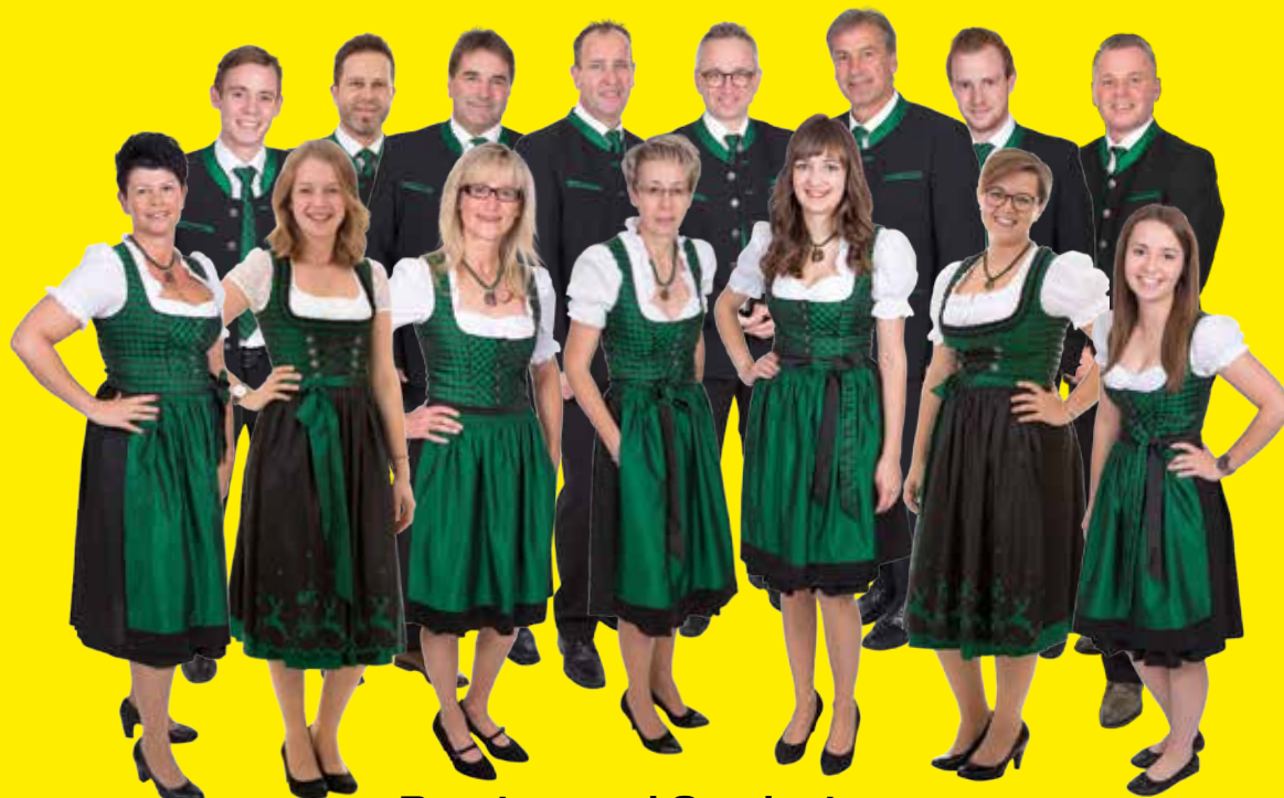
Berater- und Serviceteam der Raiffeisenbank

... bei allen weiteren Geld- und Versicherungsangelegenheiten.