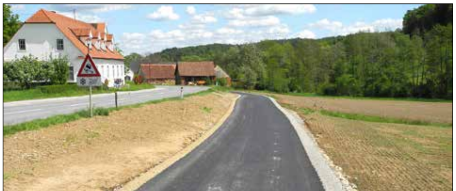
Der Radweg nach Gersdorf wird durch das Ortsgebiet von Schachen führen.

muss noch herausgestrichen werden, das ihn mit besonderer Freude erfüllt: Das ist das Projekt „Fertigstellung des Radweges in Richtung Gersdorf“. Dieser Bauabschnitt umfasst nicht nur den weiteren Ausbau des Radweges, sondern auch die Errichtung eines Gehsteiges im Ortsgebiet von Schachen bis hin zur Bushaltestelle. Gleichzeitig wird auch die Wasserversorgung erweitert sowie die Erdverkabelung des E-Werkes Schafler und die Leerverrohrung für die Glasfaserleitung durchgeführt. Der Spatenstich für dieses Bauvorhaben erfolgt(e) am Mittwoch, dem 24. März 2021, die Fertigstellung ist für den Sommer geplant. Herbert Baier wird in den kommenden Jahren sich auch mehr seinen Hobbys widmen können, und zwar unter anderem der Betreuung seiner Landwirtschaft und seiner Pferde.