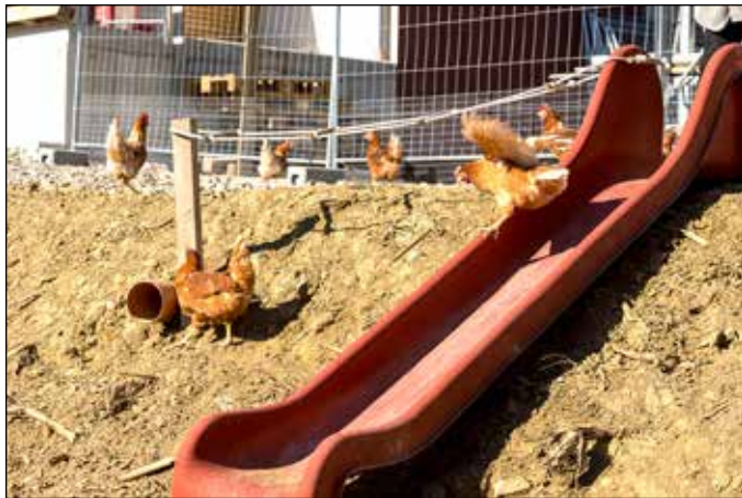
Hühnergarten mit Rutsche und einigen Spielelementen.

Freilandeier von verspielten Hühnern in den Regionen ab Hof und in ausgewählten Märkten erhältlich.