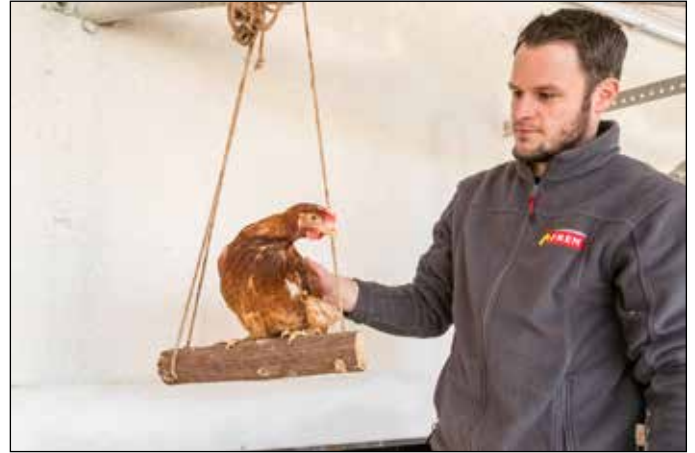
Henne „Maja“ lässt sich gerne auf der Schaukel verwöhnen.