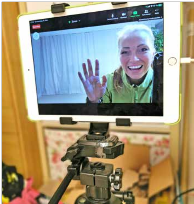
Die Gesundheitstrainings im Kulmland finden derzeit noch online statt. Die Teilnehmer sind begeistert.

Seit September 2020 werden unter dem Projekt „Jackpot.fit“ in jeder Kulmlandgemeinde Gesundheitstrainings angeboten. Aufgrund der derzeitigen Corona-Bestimmungen ist dies im Moment nur Online via Zoom Meeting möglich. Trotz allem wird das Angebot von den Teilnehmerinnen und Teilnehmern auch in dieser Form sehr gerne angenommen. Anmeldungen sind jederzeit unter veranstaltungen@focusgesund.at möglich.