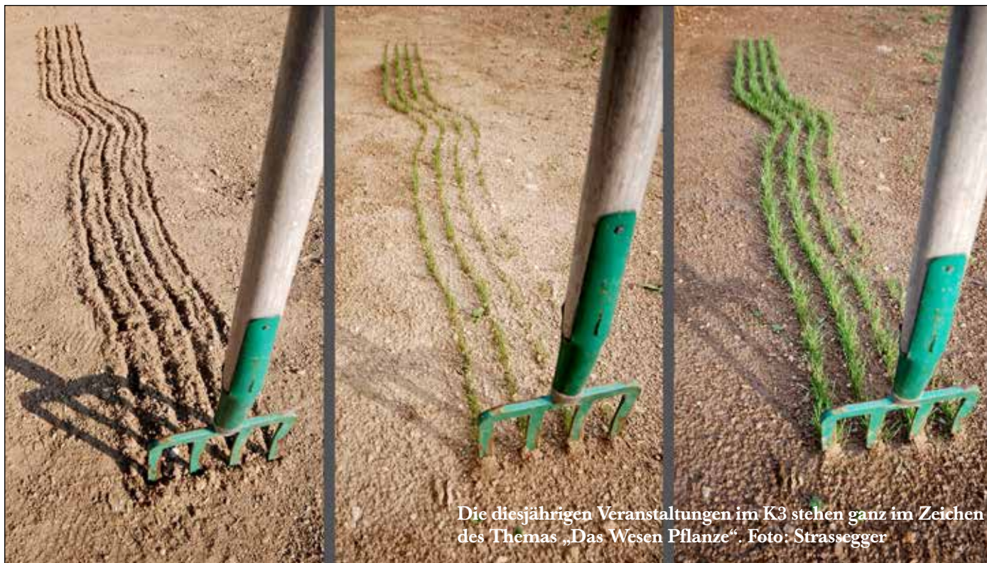
Die diesjährigen Veranstaltungen im K3 stehen ganz im Zeichen des Themas „Das Wesen Pflanze“.